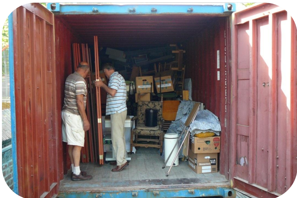
Foto: De container is bijna vol

Het is alweer een paar maanden geleden, dat ik in “Onze Kerk” geschreven heb over de restauratie. Inmiddels zijn er weer genoeg dingen veranderd en bijgekomen om een nieuw stukje aan te kunnen wijden. Laat ik dit verhaal splitsen in vier delen, n.l. de voortgang, asbest en verwarming, rijkssubsidie en natuursteen. Deze vier onderwerpen staan niet op zichzelf, in het spanningsveld tijd en geld beïnvloeden ze elkaar, maar het komt de leesbaarheid ten goede als ik ze apart behandel.