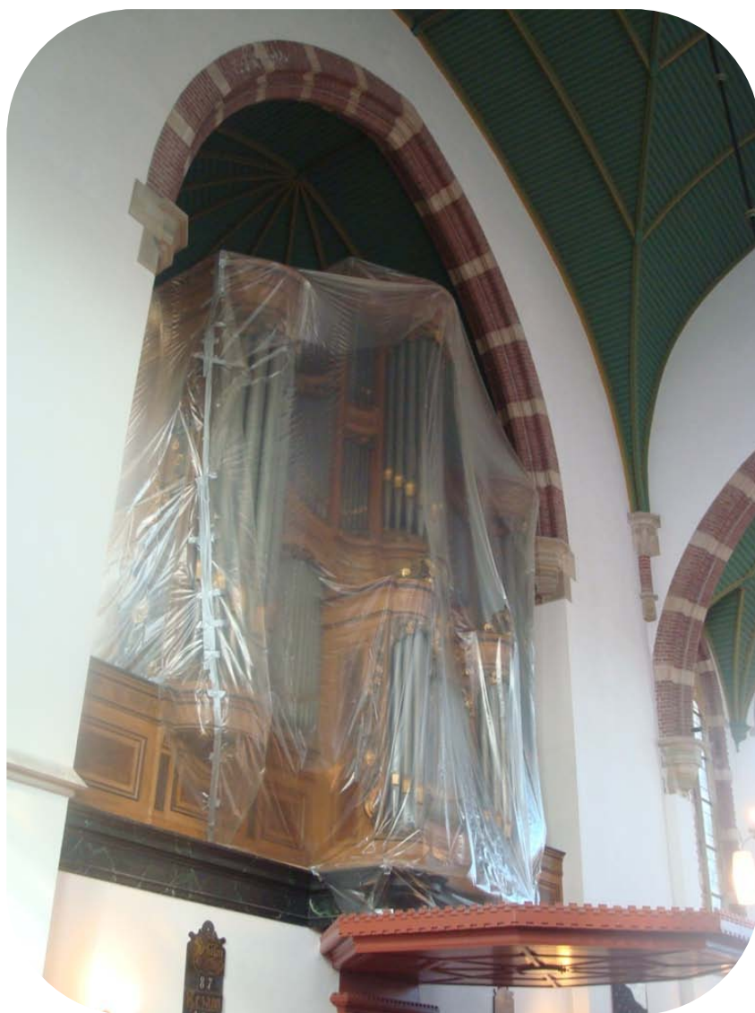
Het ingepakte orgel