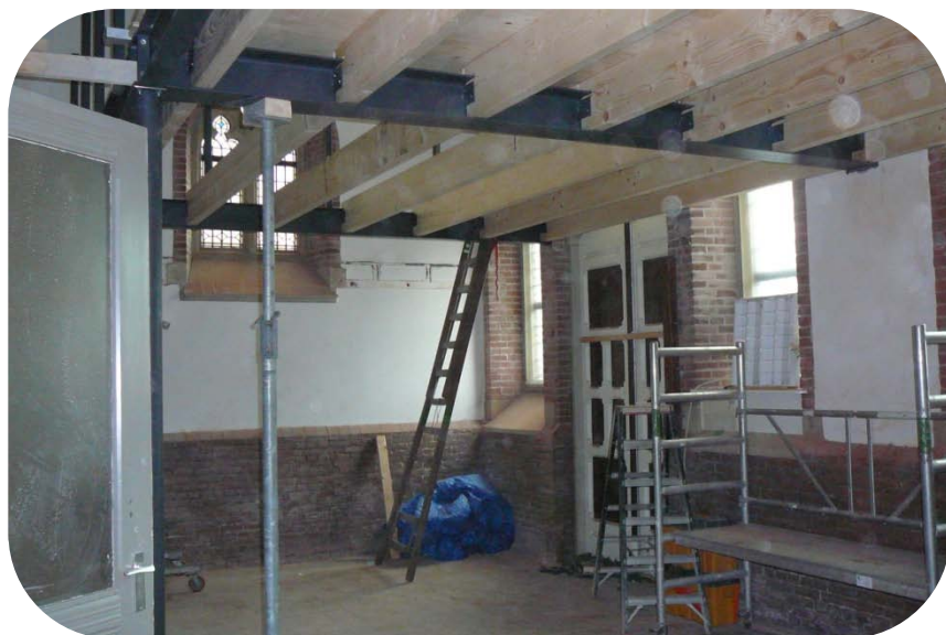
Het vroeger jeugdhonk met extra verdieping