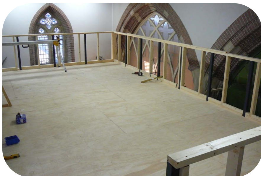
Het nieuwe jeugdhonk in aanbouw